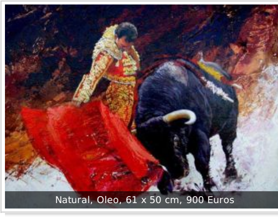
Natural, Oleo, 61 x 50 cm, 900 Euros